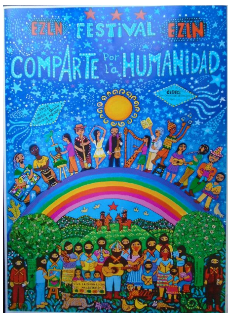
Εικόνα 6: Υπάρχει πλέον μια διακριτή ζαπατιστική τεχνοτροπία που έχει βασιστεί στα έργα της ζωγράφου Beatriz Aurora. Στη φωτογραφία εικονίζεται η αφίσα που έφτιαξε η συγκεκριμένη καλλιτέχνης για το φεστιβάλ τέχνης CompArte . Με τα συγκεκριμένα φεστιβάλ προωθήθηκε η τέχνη στις κοινότητες που πλέον παράγουν ζωγραφική, μουσική, θέατρο, ποίηση, κ.ά.

Στα επόμενα βήματα που θα αποφασιστούν τον Οκτώβρη 2018 ο EZLN προτείνει μεταξύ άλλων τη δημιουργία ενός Συντονιστικού ή μιας Ομοσπονδίας Δικτύων και μια διεθνή συνάντηση δικτύων τον Δεκέμβρη.